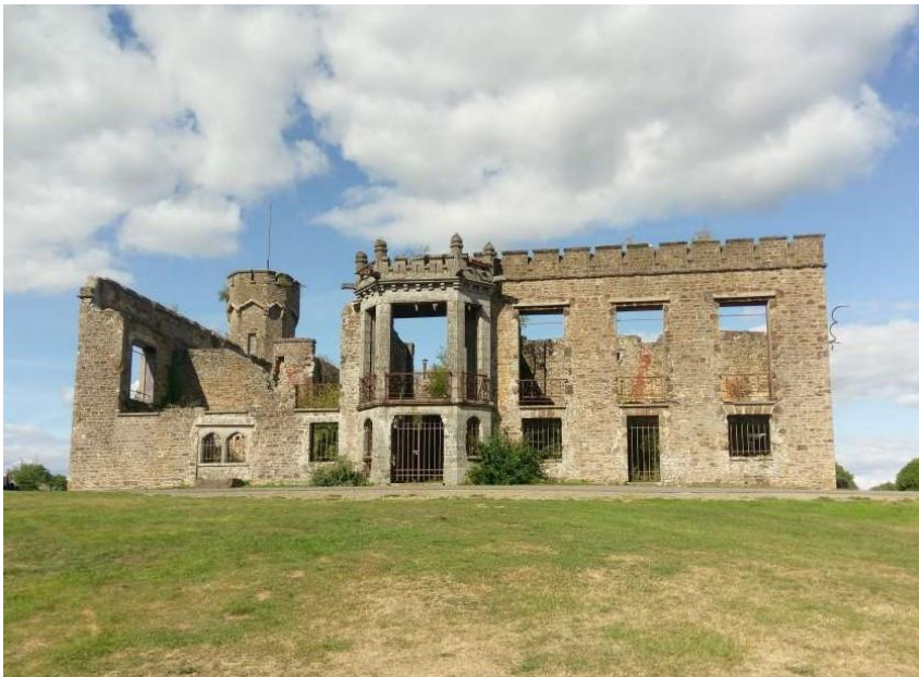
Mont de Cerisy-Belle-Étoile